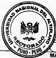
MARTHA N. TAPIA INFANTES RECTORA UNIVERSIDAD NACIONAL DEL ALTIPLANO